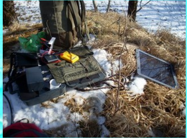
et celle de FOFLS Damien