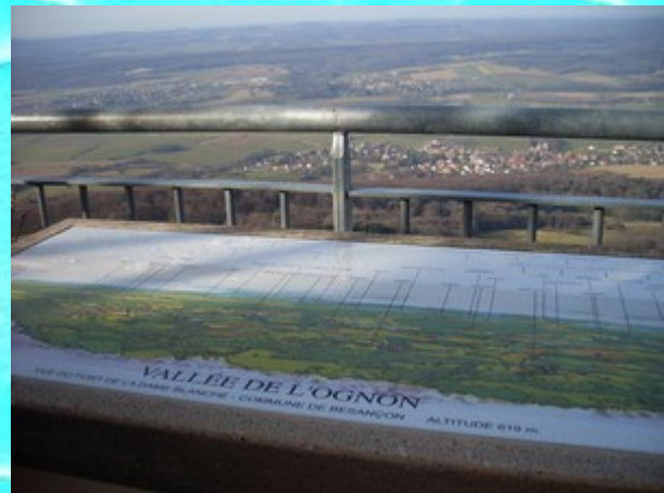
La table d'orientation

Les coordonnées GPS du point où nous avons activés sont: 47^{\circ}19'07''\text{N} et 006^{\circ}03'38'' . C'est une petite butte à côté du point référencé, qui est plus favorable au trafic radio. Car la végétation qui est très dense au sommet (seulement du feuillus qui laissent paraître le relief en période hivernal) rend difficile l'accès et l'utilisation de matériel radio au point du SOTA initial.