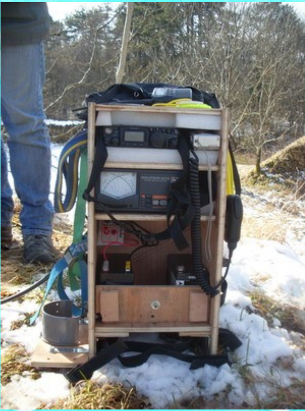
Station de FOFLT Pascal