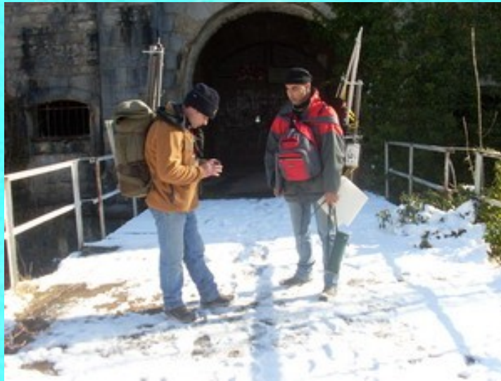
L'entrée du fort.