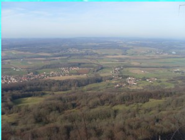
Depuis le point de vue