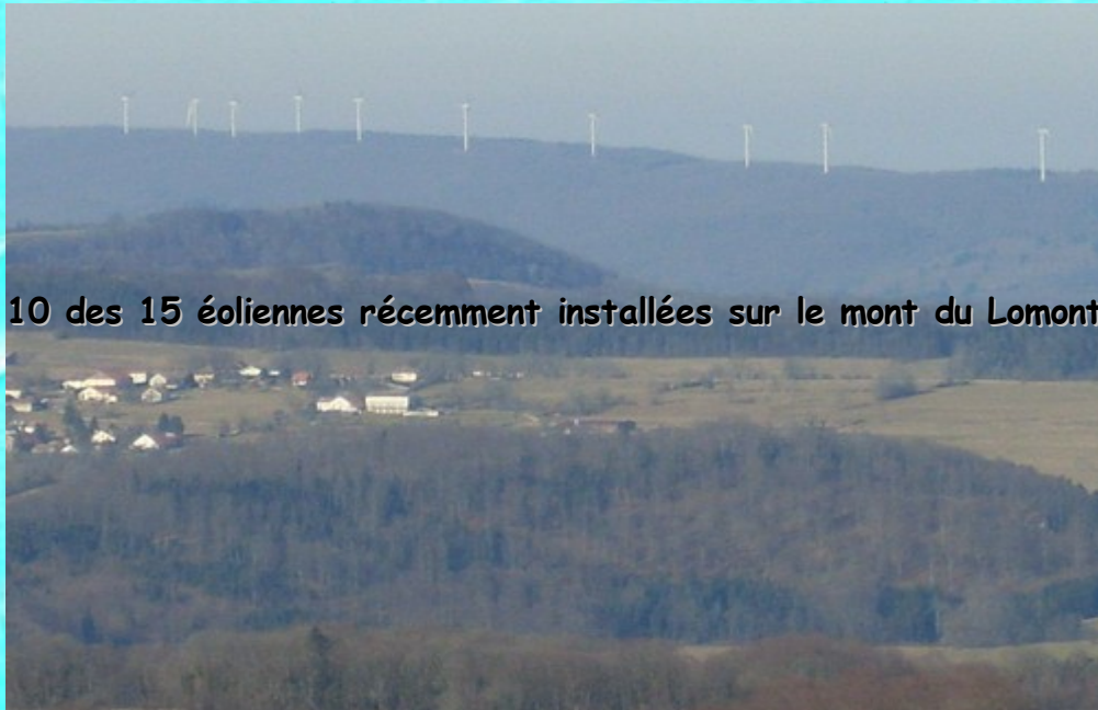
10 des 15 éoliennes récemment installées sur le mont du Lomont