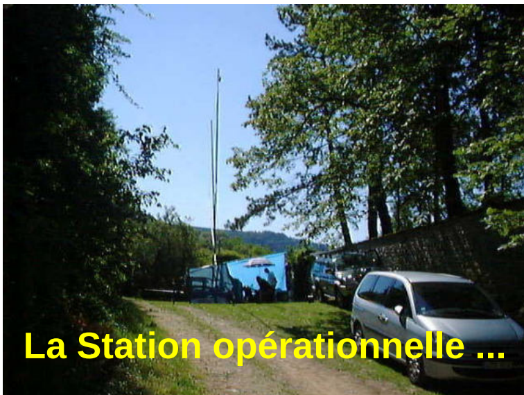
La Station opérationnelle ...