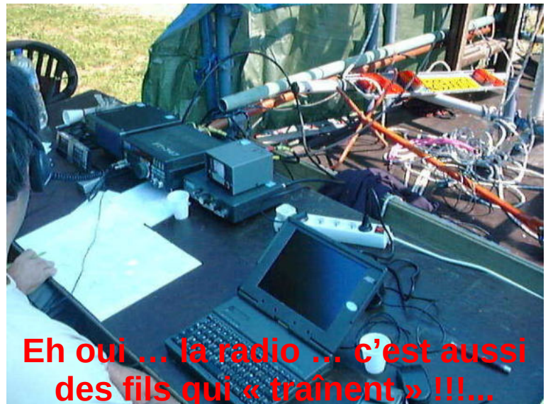
Eh oui ... la radio ... c'est aussi des fils qui « traînent » !!!...