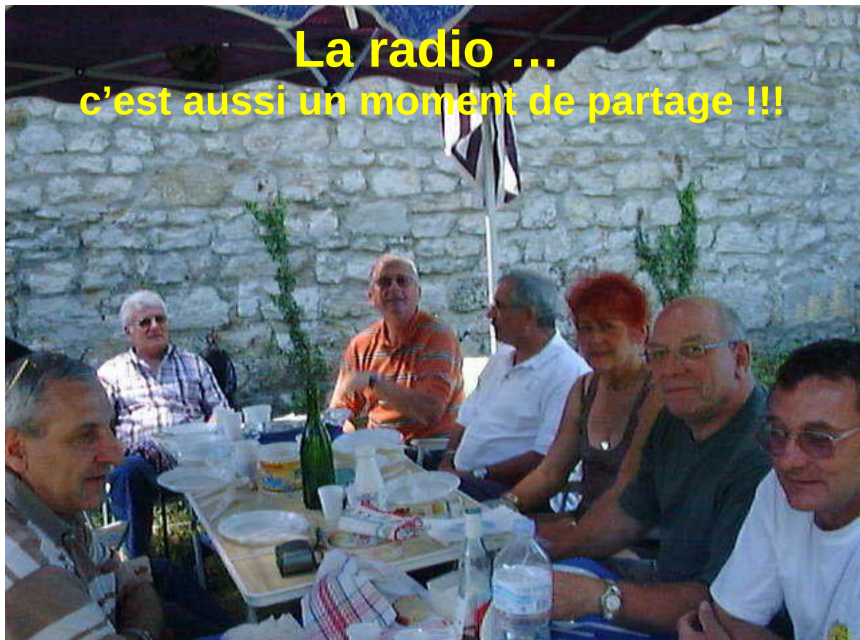
La radio ... c'est aussi un moment de partage !!!