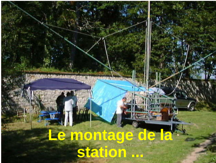
Le montage de la station ...