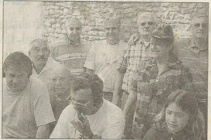
Les radioamateurs, une bande d'amis joyeux, ont relevé le challenge des Forts et châteaux à Treffort

Pour le challenge à Treffort, le poste F6 KJDIP reçoit des appels d'autres radioamateurs. Chaque appel percevra un carte (accusé de