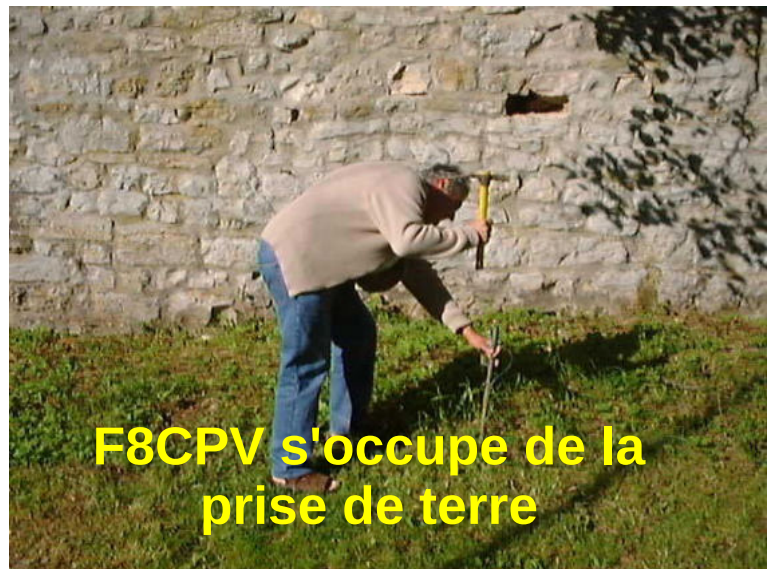
F8CPV s'occupe de la prise de terre